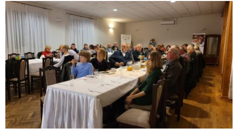
EM en Polonia

Al final del proyecto se organizaron actos multiplicadores (de un día de duración) en todos los países socios. En ellos se difundieron los resultados de todo el proyecto. Se trataba de un acto final que alternaba entre una conferencia, un taller y un acto de creación de redes, según las preferencias y el grupo destinatario del socio organizador. Los participantes en el acto fueron partes interesadas del sector agrícola, agentes de las zonas rurales, agricultores, propietarios y empleados de PYME del sector agrícola, autónomos o directores de PYME de distintos sectores, representantes de las autoridades locales (municipios, cámaras de agricultura), asesores de desarrollo rural y posibles grupos destinatarios de futuros facilitadores.