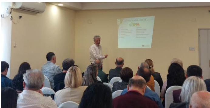
Prueba piloto en Macedonia del Norte

Durante la prueba piloto se esperaba poder reconocer los puntos fuertes y las posibilidades de los nuevos materiales de formación y criticar el punto más débil con el fin de componer recomendaciones para mejorar el resultado final tras la formación piloto. La metodología preparada y compartida con los socios. Durante el acto se presentaron los materiales, se solicitó la opinión de los participantes a través de un cuestionario.