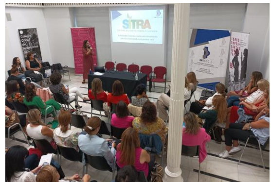
EM en España

Al final del proyecto se organizaron actos multiplicadores (de un día de duración) en todos los países socios. En ellos se difundieron los resultados de todo el proyecto. Se trataba de un acto final que alternaba entre una conferencia, un taller y un acto de creación de redes, según las preferencias y el grupo destinatario del socio organizador. Los participantes en el acto fueron partes interesadas del sector agrícola, agentes de las zonas rurales, agricultores, propietarios y empleados de PYME del sector agrícola, autónomos o directores de PYME de distintos sectores, representantes de las autoridades locales (municipios, cámaras de agricultura), asesores de desarrollo rural y posibles grupos destinatarios de futuros facilitadores.